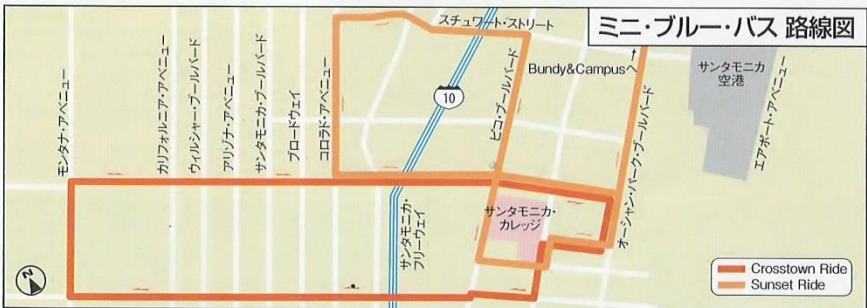
ミニ・ブルー・バス 路線図