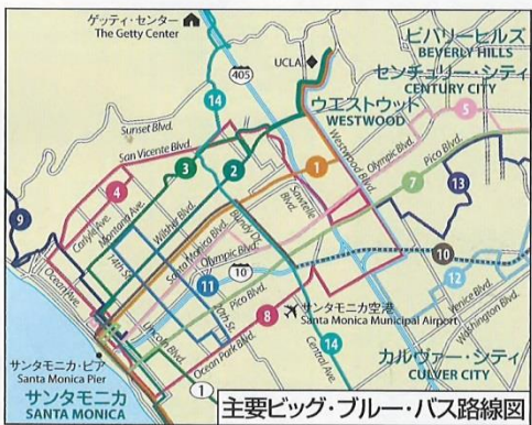
主要ビッグ・ブルー・バス路線図