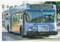
ブルーの車体が目印

DATA ⑤5時30分~24時ごろ(路線により異なる) ③$1(急行は$2) 1日券$4 URL bigbluebus.com