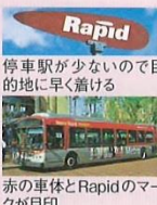
赤の車体とRapidのマークが目印

メトロバスと同じMTAが運営する急行バス。700~799番のこと。メトロバスに比べて停車する停留所が少なく、目的地に速く移動できるのが利点。モンテベロからダウンタウンを経由してサンタモニカを結ぶ720番は、旅行者にも利用価値が高い。基本料金は$1.50で、利用方法はメトロバスと同じ。